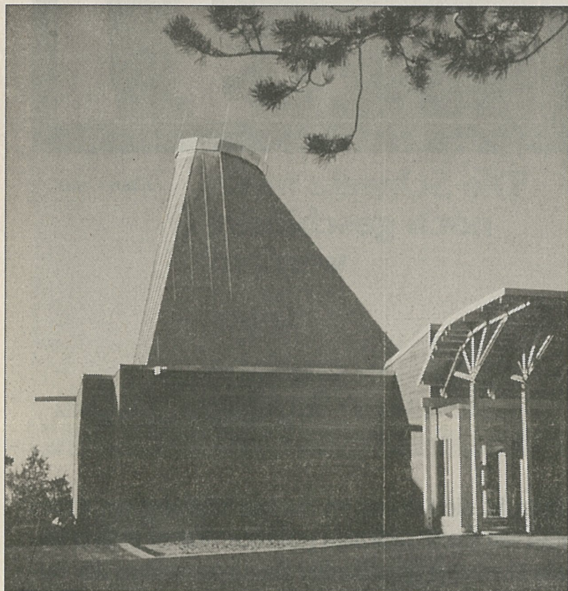
Das Samenland-Zentrum von Bjerk & Bjørge in Karasjok, 1990.

Die Wiederentdeckung der Stabbautechnik, bei der im Gegensatz zur Blockbautechnik vertikale Hölzer als freistehende oder in die Aussenwand integrierte Säulen die Dachlast auf das Fundament übertragen, erfolgte Mitte des letzten Jahr-